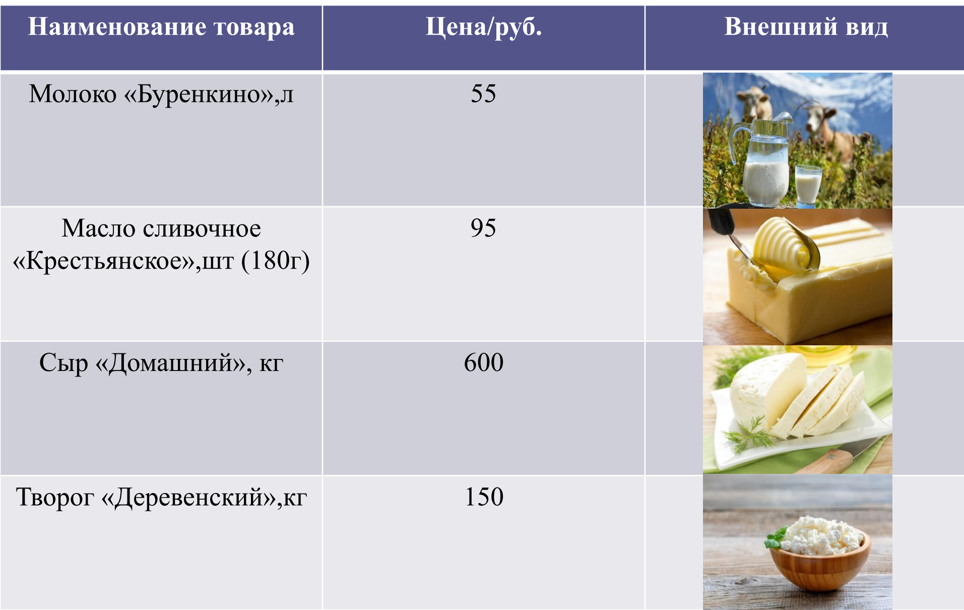
Таблица 1- Реализуемая продукция