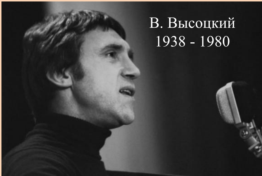
В. Высоцкий 1938 - 1980

Ах, чёрный лебедь, хриплый лебедь, Мне так не спеть.