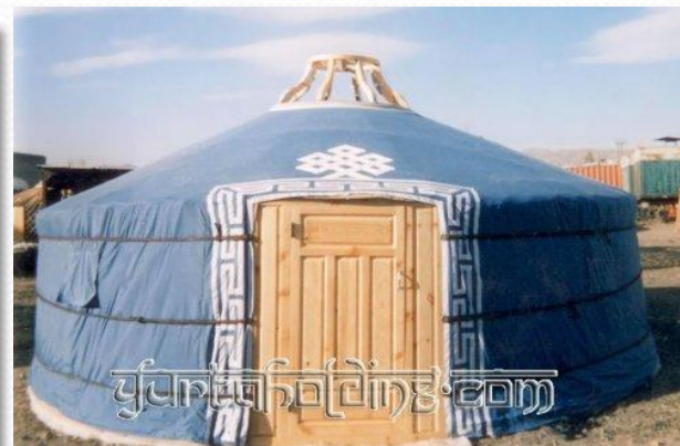
Современный дизайн юрты