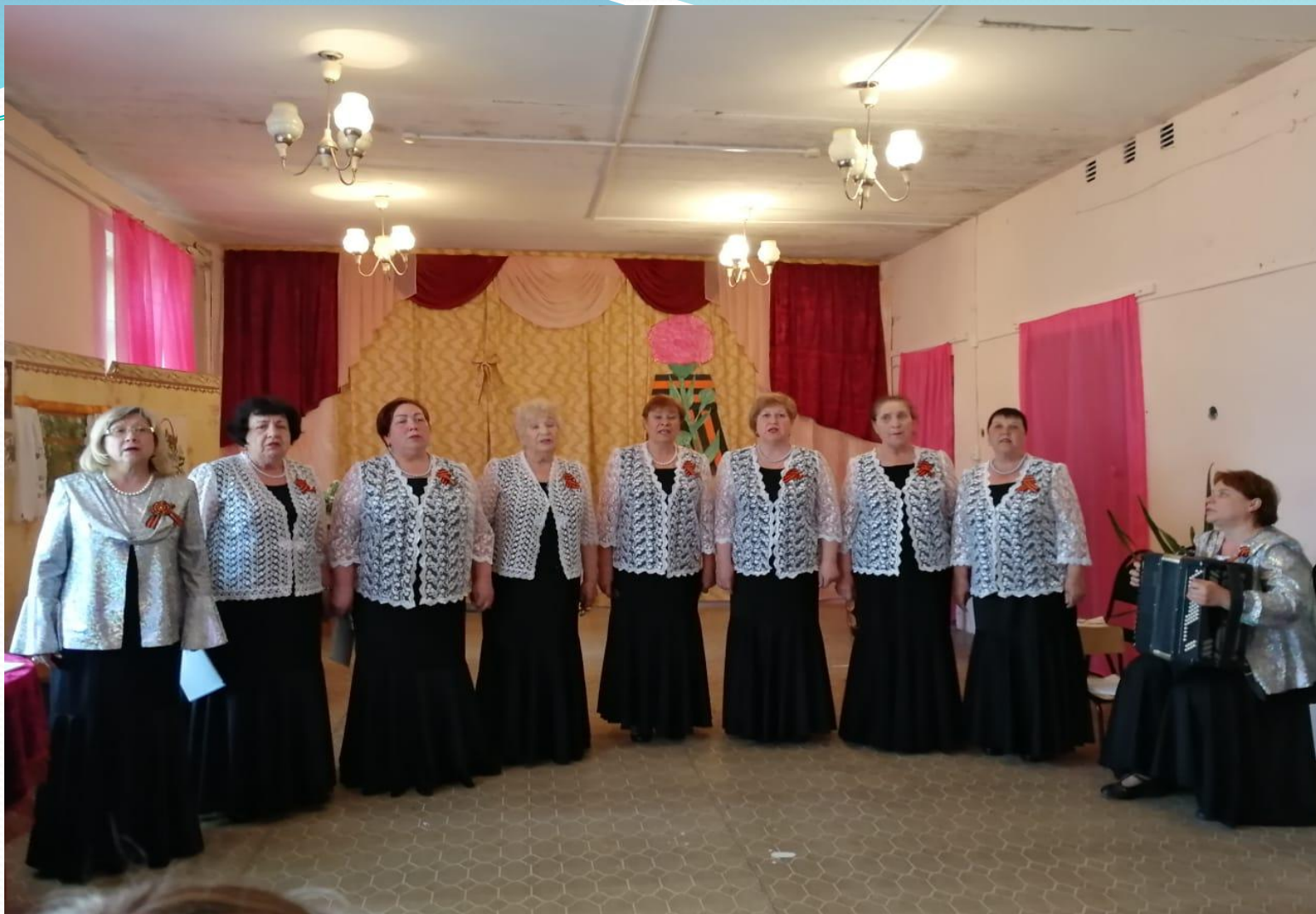
Народный хор «Рябинушка» исполняет песню «Баллада о солдате»