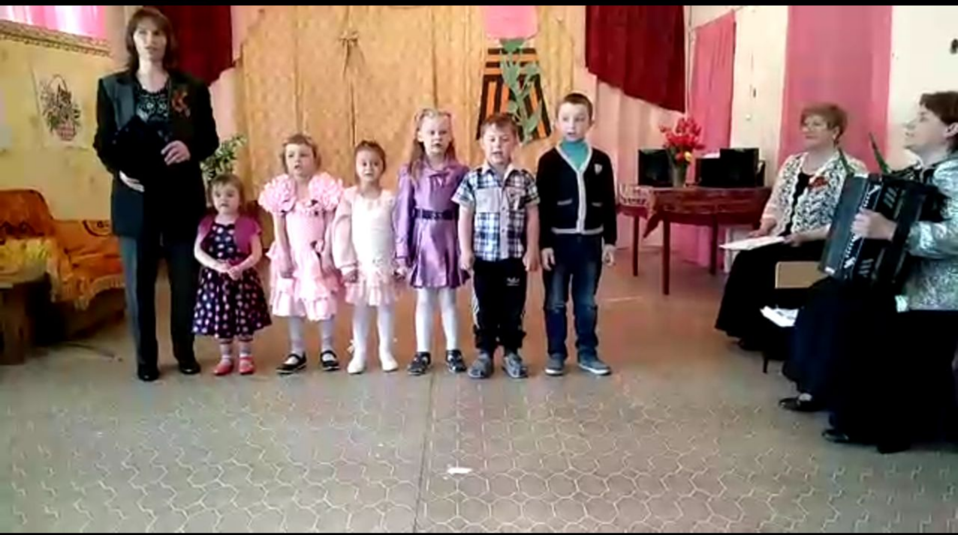
Песня «Большой праздник» исполняют воспитанники детского сада