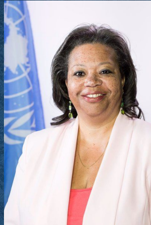
Сьюзан Д. Пейдж (США). Заместитель Специального представителя Генерального секретаря