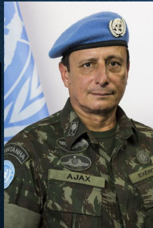
Генерал-лейтенант Аякс Пурту Пинейру (Бразилия). Командующий силами