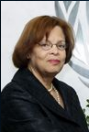
Сандра Оноре (Тринидад и Тобаго). Специальный представитель Генерального секретаря и Глава Миссии