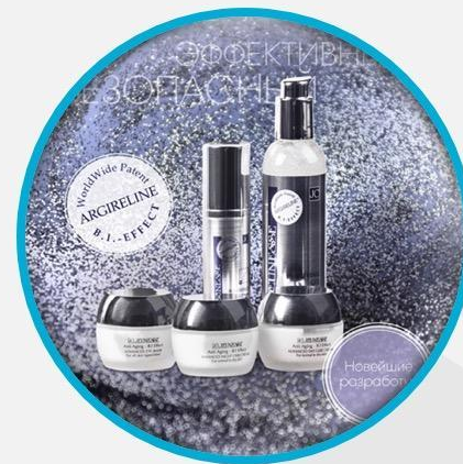
Sun Way Cosmetics

Компания предлагает своим потребителям и партнерам продукты наивысшего качества и потребительской ценности, улучшающие жизнь сегодняшнего и будущего поколений по всему миру.