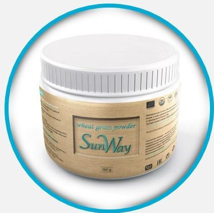
Sun Way Bio