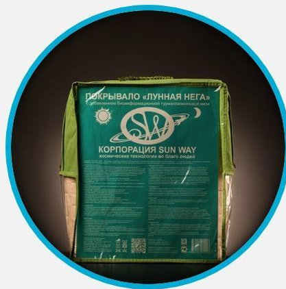
Sun Way Bioenergy