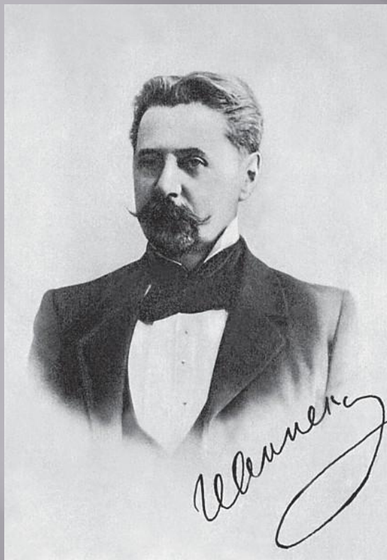
И. Ф. Анненский