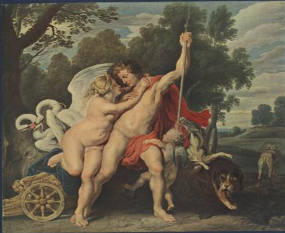
Рубенс. «Венера и Адонис». Императорский Эрмитаж.

Обложка номера 40-41 за 1915 с репродукцией «Венеры и Адониса» Рубенса.