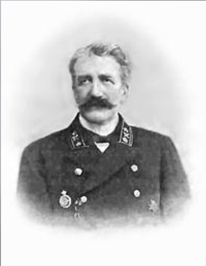
Граф Николай Иванович де Рошфор (1878 — 1881).