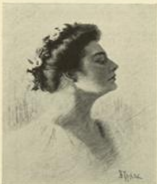
Выставка Петроградского Общества Художниковъ.