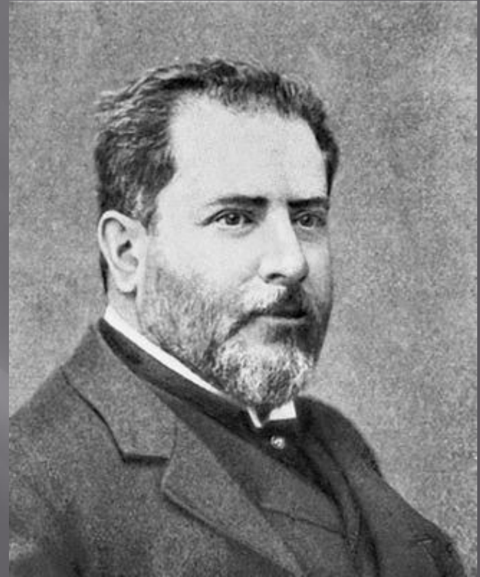
Леонтий Николаевич Бенуа (1892 — 1895)