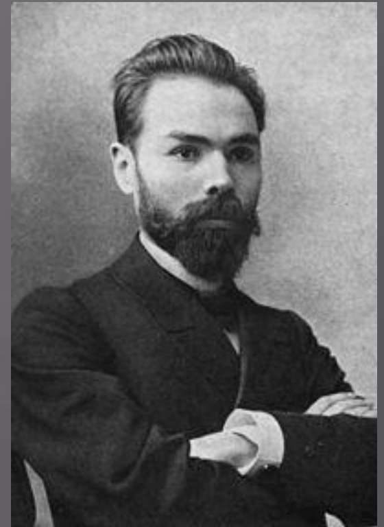
В. Я. Брюсов