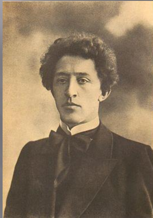
А. А. Блок