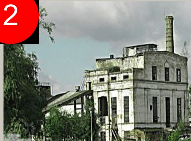
Кохавінська паперова фабрика