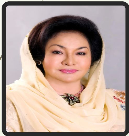
Датин Падука Сери Росмах Мансор