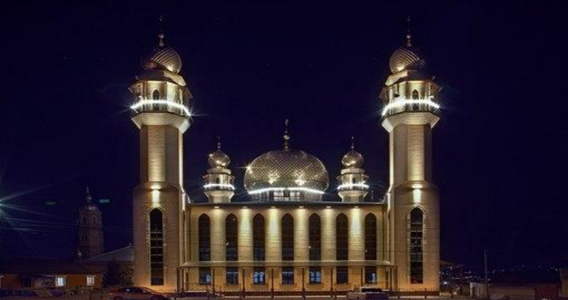
Мечеть в Ингушетий Гамурзиево