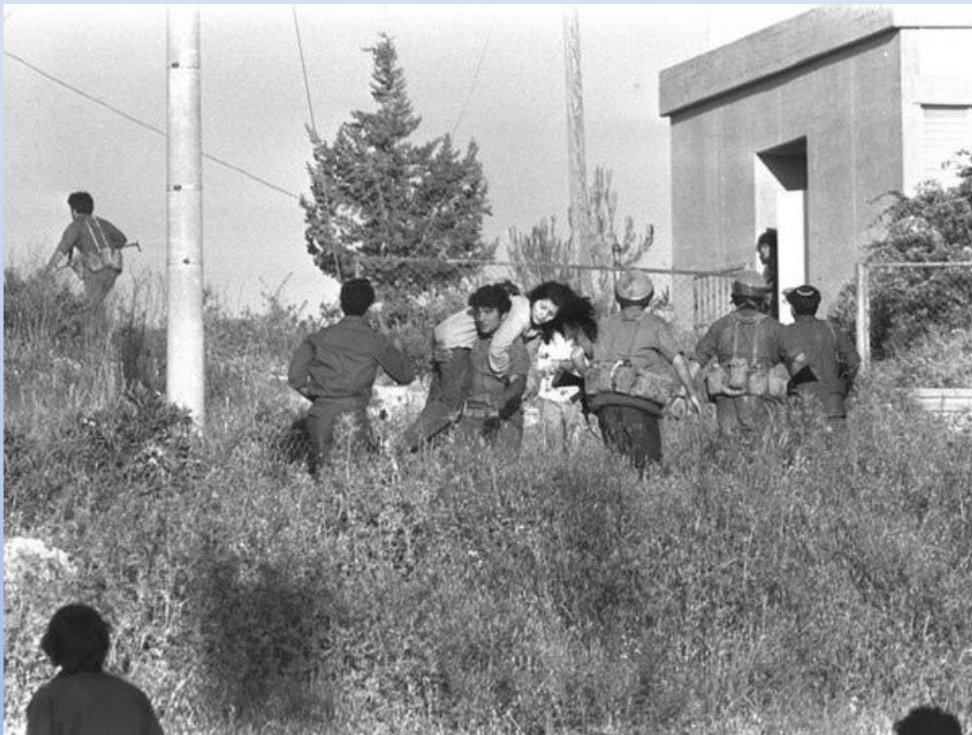
Резня в Маалоте 14-15 мая 1974