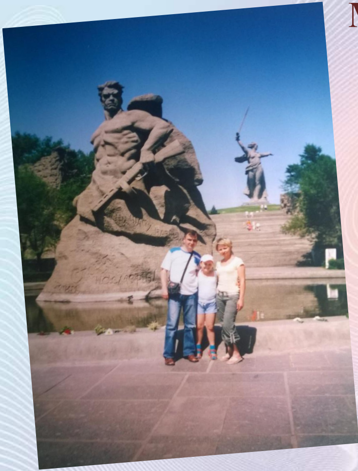
Площадь "Стоять насмерть"