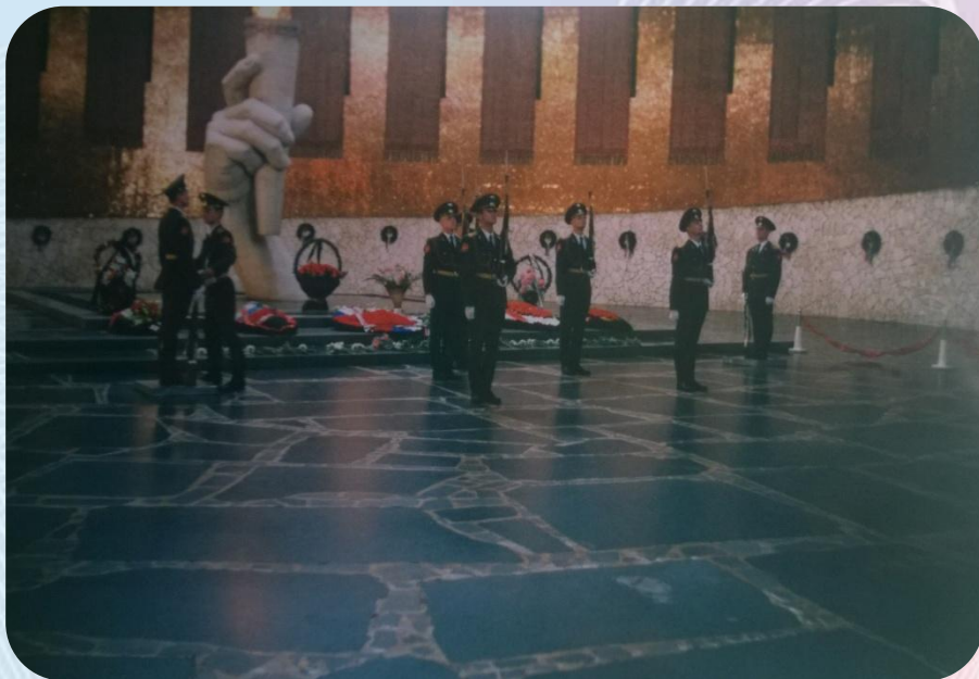
Зал Воинской славы