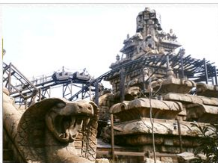
INDIANA JONES RIDE

Продолжительность поездки 1 минута 30 секунд, длина 599 метров, высота 43 м, максимальная скорость 75 км/ч