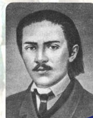
Петр Никитич Ткачев (1844—1885)