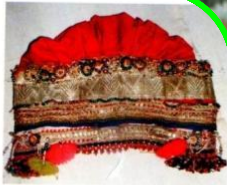
Головной убор жителей д. Скрабино