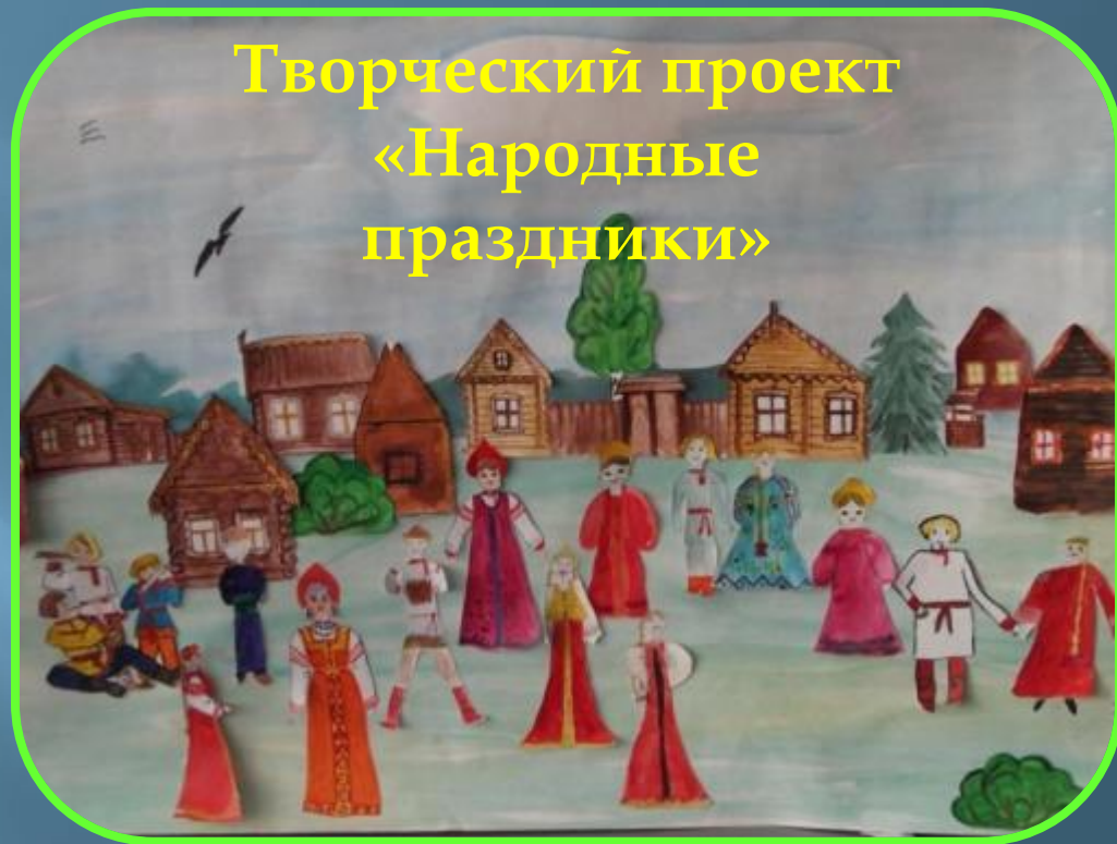
Творческий проект «Народные праздники»