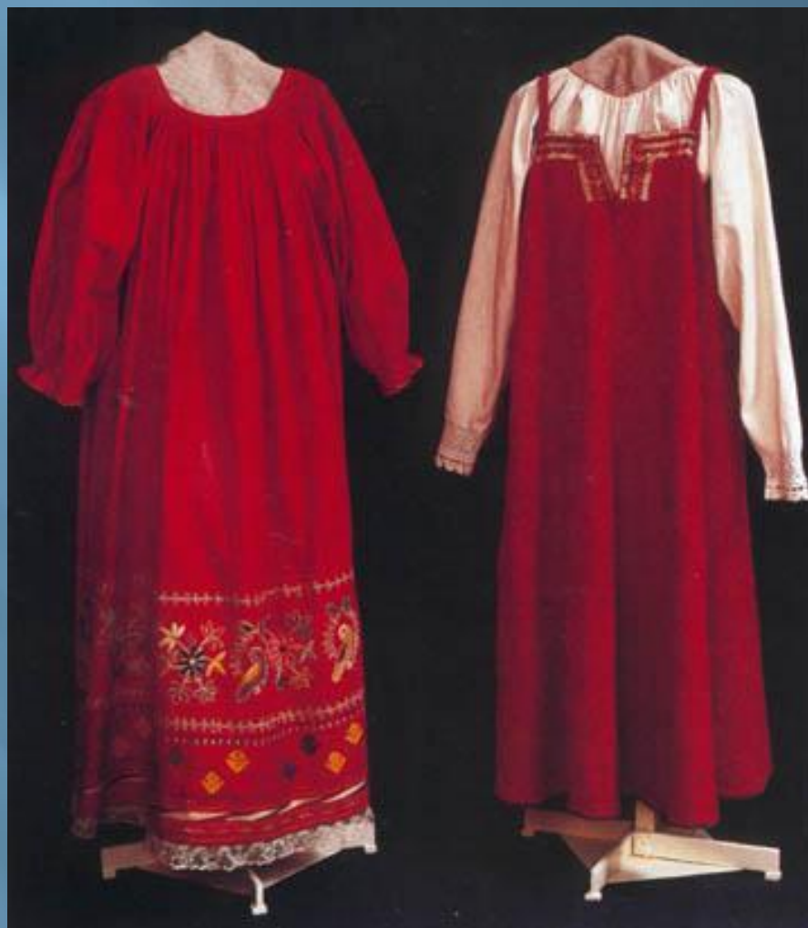
Народный костюм 19 века