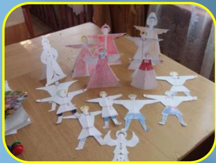
Работы детей. Тема: «Русский костюм» (Конструирование из