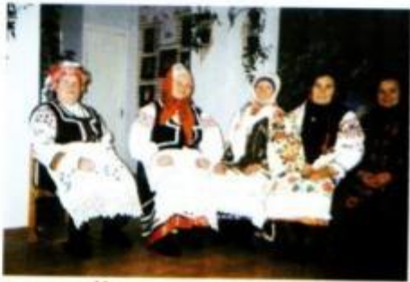
Мастерицы Хмелево в народных костюмах