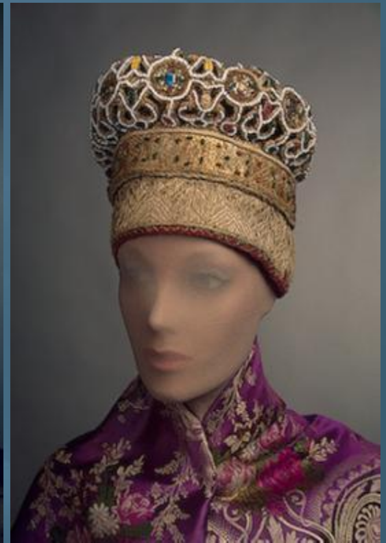
Костюм Московской Руси 15 – 17 века