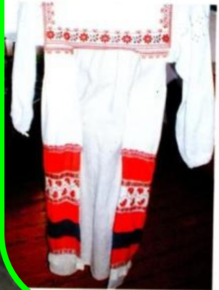
Элементы одежды: фартук, рубашка