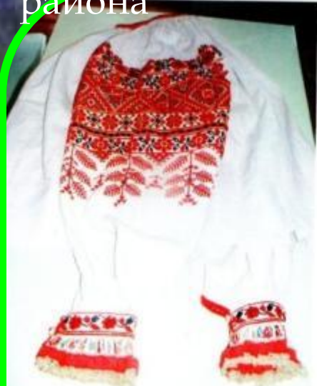
Кашуля изготовлена А. М. Евтиховой, Орменка