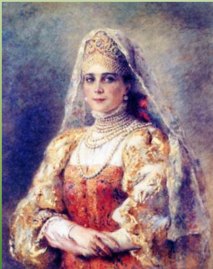
Портрет княгини Юсуповой в русском костюме