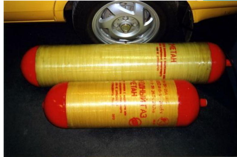
Автомобильные газовые баллоны (Метан)