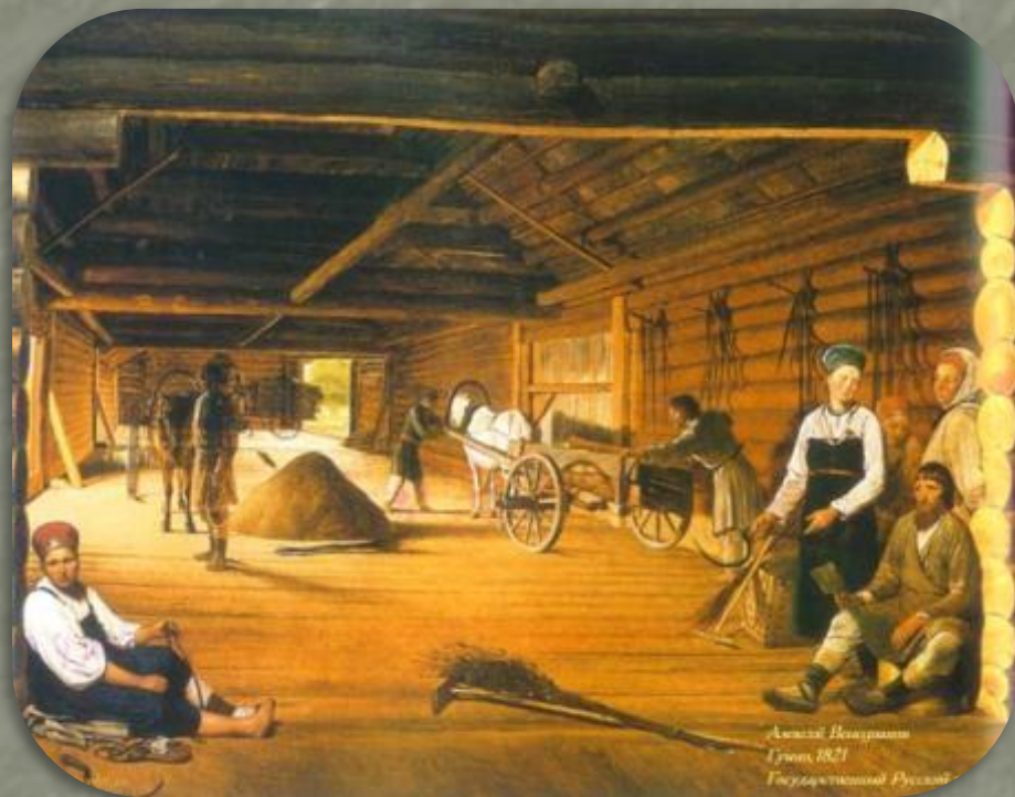
А. Венецианов. Гумно.