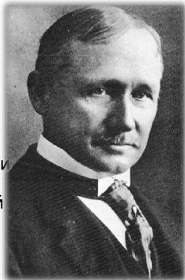
Фредерик Уинслоу Тейлор (1856-1915)