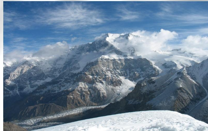
Пик Коммунизма ( 7495 м )