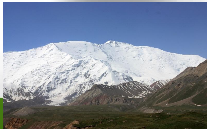
Пик Ленина ( 7134 м )