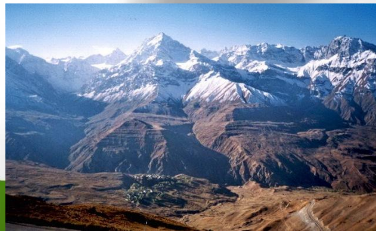
Горный край Памир