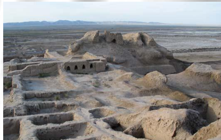
Зороастрийская цивилизация Согдиана