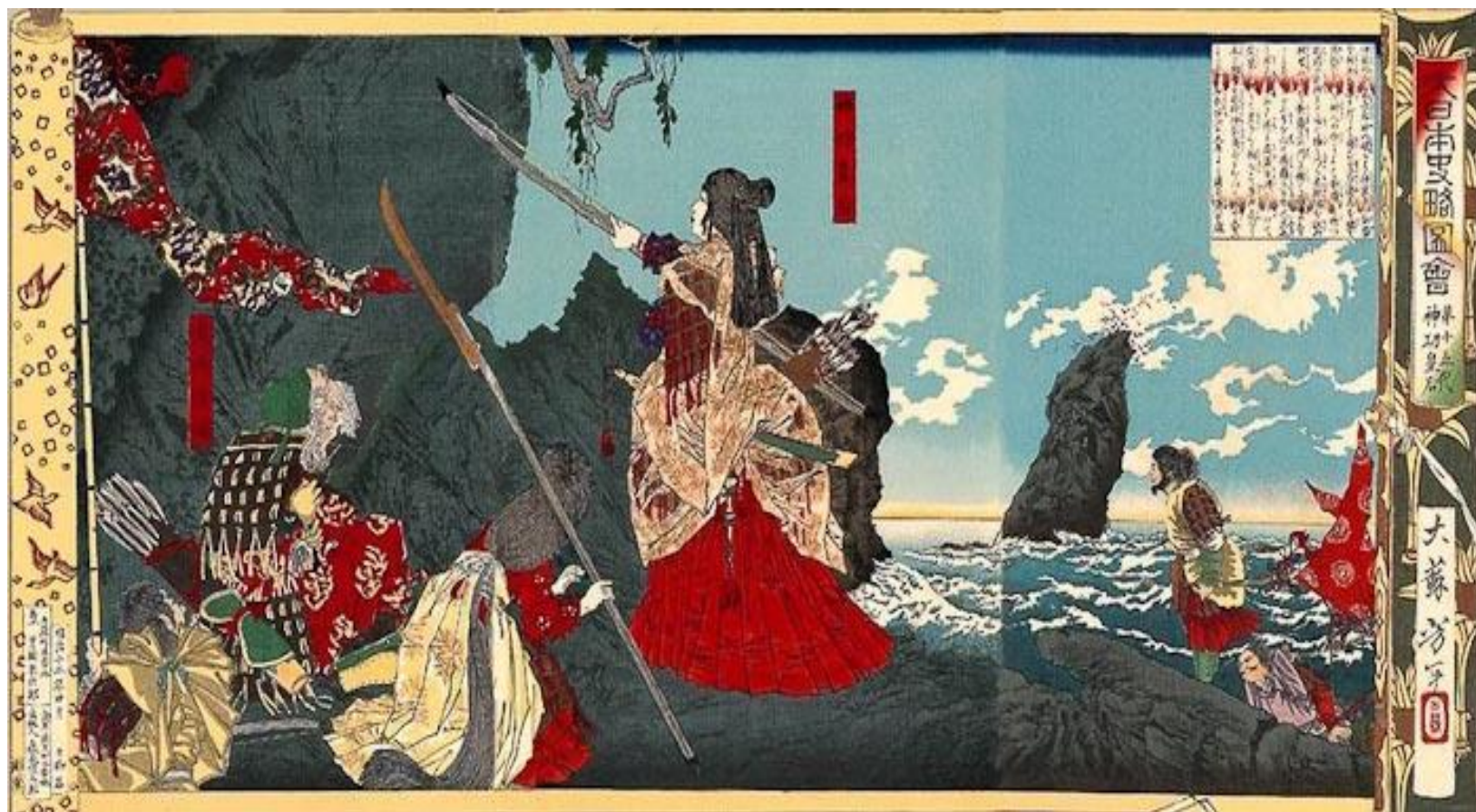
Императрица Дзингу высаживается в Корее. Японская гравюра XIX в.