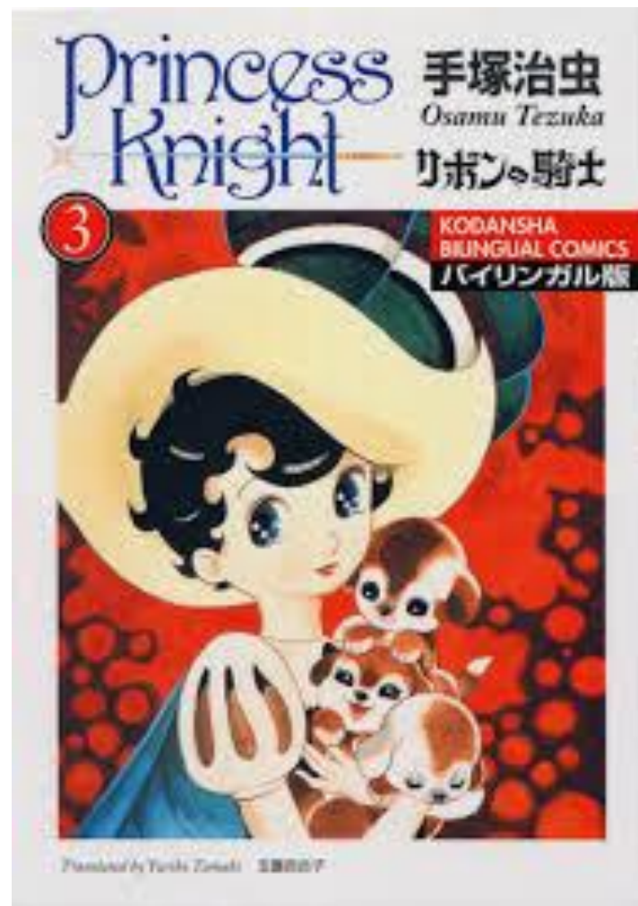
Ribbon no Kishi (Принцесса – рыцарь) 1967 г.