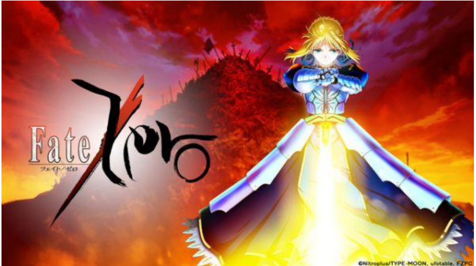
Fate/Zero (Судьба/Начало) 2011-2012 гг.