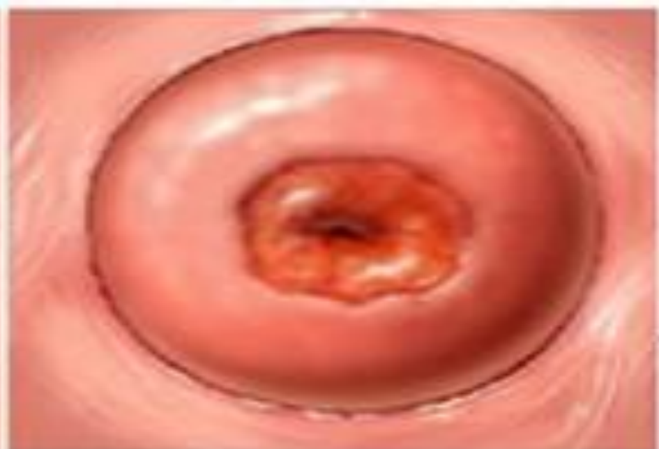
эрозия шейки матки

ШЫНАЙЫ ЭРОЗИЯ --сирек кездеседі, ол жатыр немесе қынапта вирусты немесе бактериалы инфекцияның пайда болуынан, механикалық немесе химиялық бұзылыстардан туындайды. Жатырдың сыртқы бетінде қызарып, жара секілді болып көрінеді.