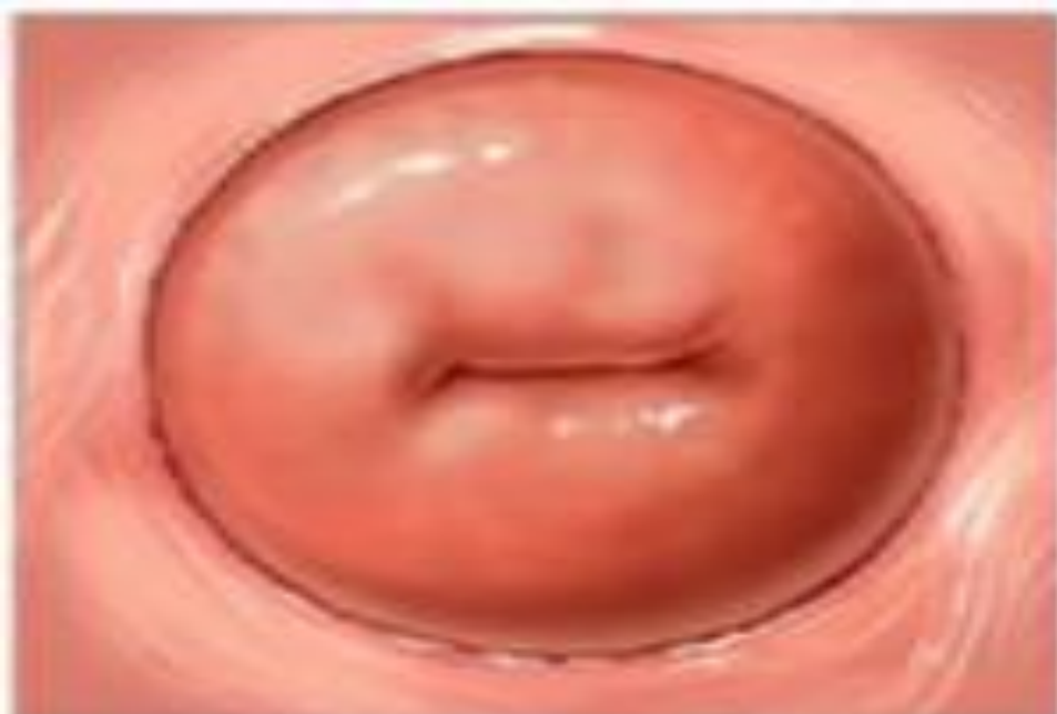
здоровая шейка матки