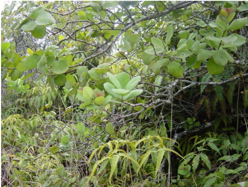
Ветка сандалового дерева

Сандаловое масло широко применялось в парфюмерии, косметике и медицине. В настоящее время экспорт сандала и сандалового масла из Индии запрещён — до восстановления популяции деревьев.