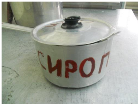
Внесение сиропа и закваски