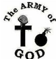
The Army of God