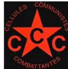
Communist Combatant Cells