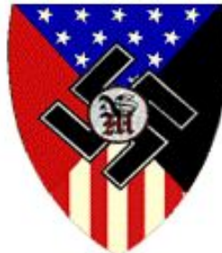
National Socialist Movement