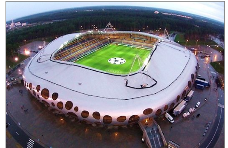
Домашняя площадка футбольного клуба БАТЭ и национальной сборной по футболу — « Борисов-арена »