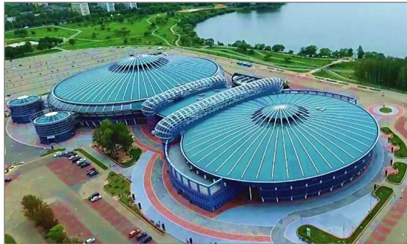
Многофункциональный культурно-спортивный и развлекательный комплекс « Чижовка-арена »