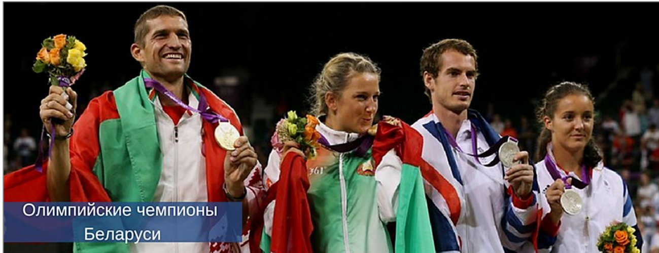
Олимпийские чемпионы Беларуси

История Беларуси на Олимпийских играх. — Лиллехаммер (Норвегия)