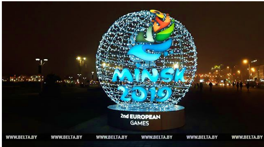
II Европейские игры примет Минск

Европейские игры , или Европиада (англ. European Games ), — региональные международные комплексные спортивные соревнования среди атлетов Европы, которые планируется проводить раз в четыре года под управлением Европейских олимпийских комитетов (ЕОК).