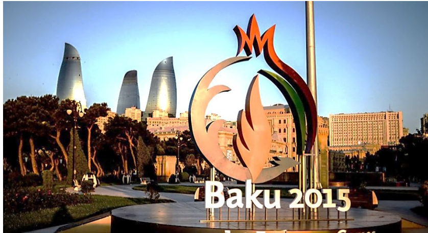
Баку — город проведения I Европейских игр