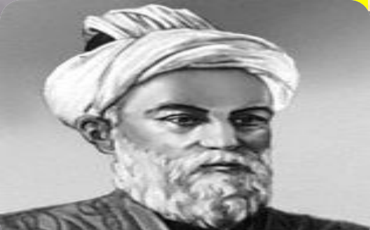
Ибн Рушд (1126-1198)

Араб философиясын европаландыруға алғашқы қадам жасаған алғашқы ойшыл. Бірінші болып арабтарға ежелгі грек философиясын, Аристотельді ашты. Аристотель философиясының әдісімен категориялар ұғымы, логика, таным туралы ілім, т.б материалистік идеалдар жетті. Сонымен қатар, Әл Кинди өз заман үшін революциялық мәні бар идеаны – адам ақылының дүниені тани алатының жариялады және ғылыми танымның ақиқат білімге апаратын үш сатысын жіктеді: