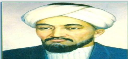
Әл Фараби (870-950)