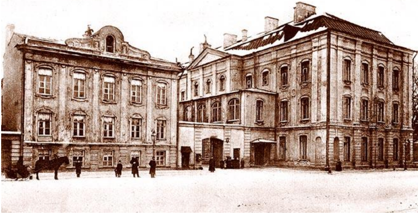
Ст. Петербургъ. Университетъ. ST. PÉTERSBOURG. L'Université.