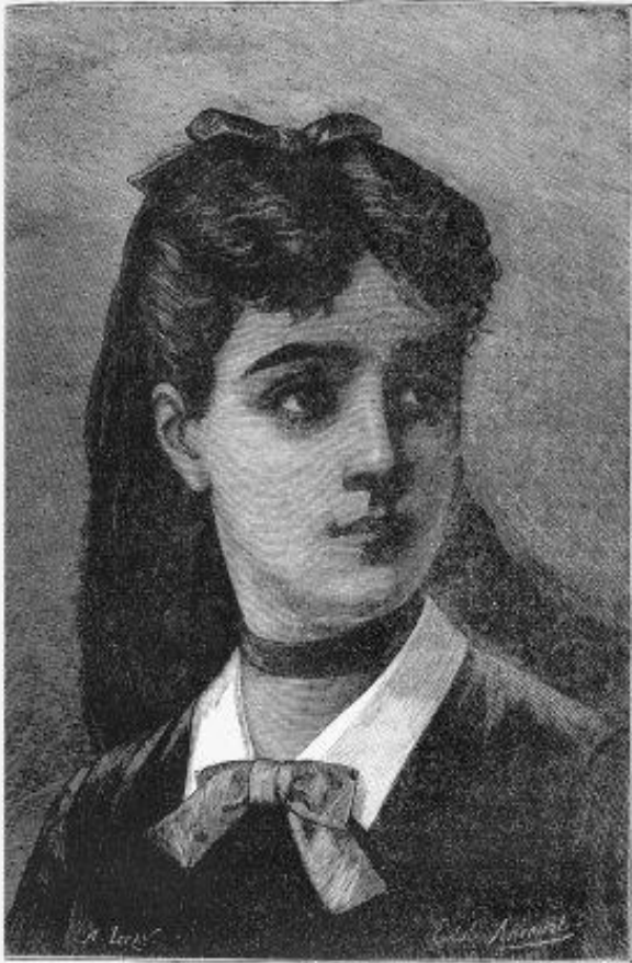
Sophie GERMAIN (portrait de), à l'âge de 11 ans.