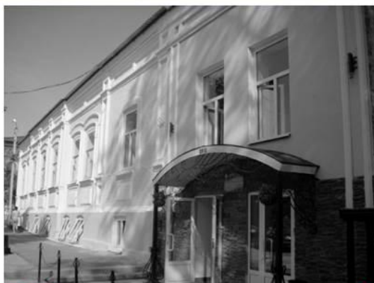
1911 год - драматический театр