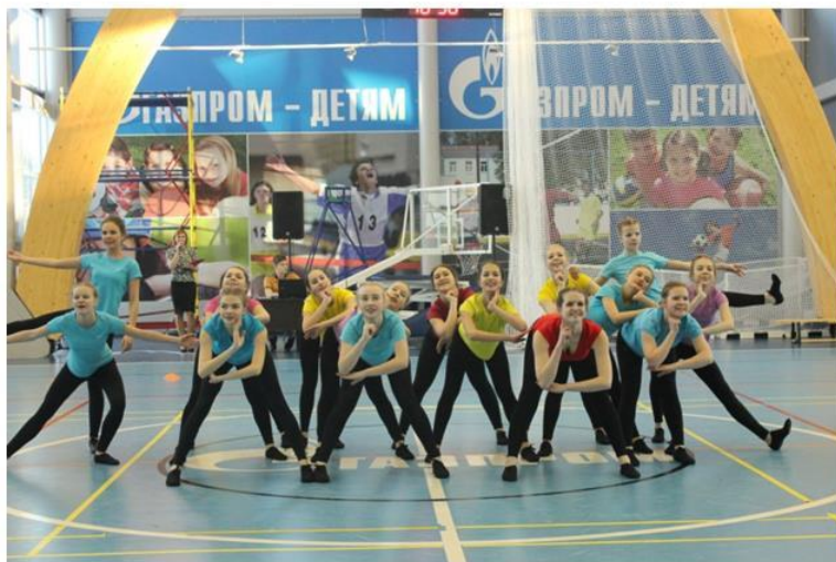
Хореографический ансамбль «Арабеск»