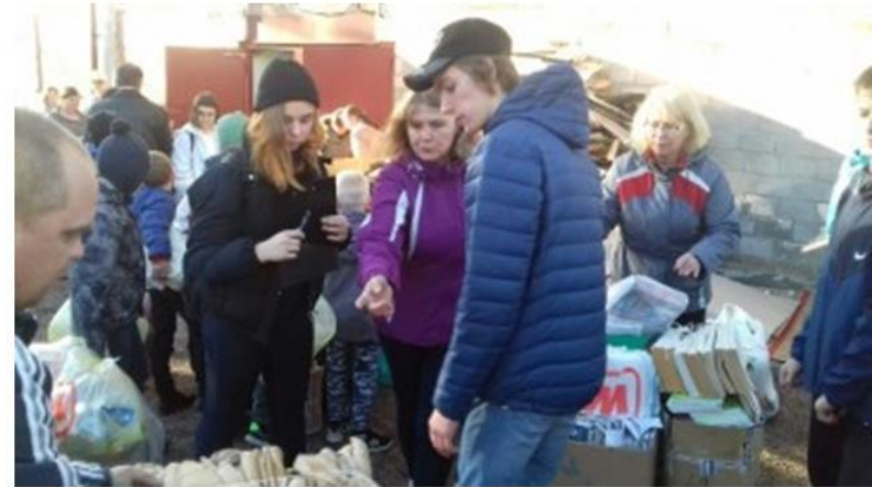
Акция в школе «Вторая жизнь мусора»