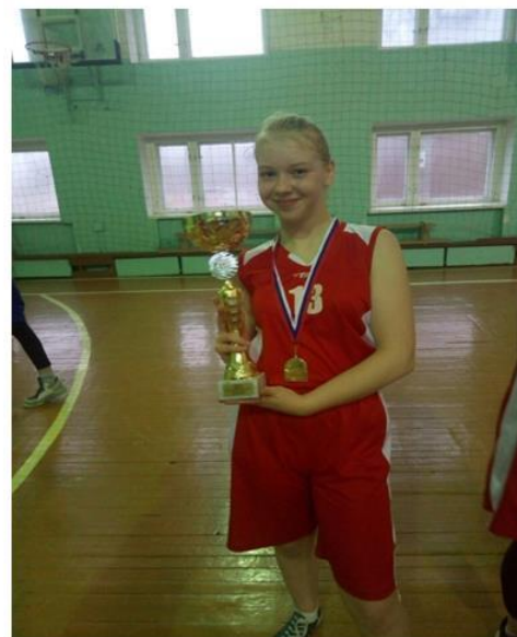
Секция по баскетболу