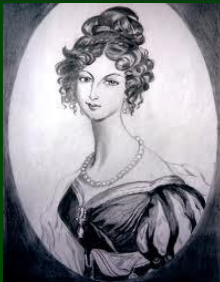
Елизавета Ксаверьевна Воронцова