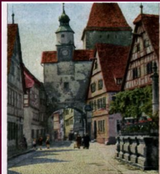
Исторический (вверху) и деловой центры города

Центр – особое место «сердце города», которое имеет своё лицо, свою атмосферу, неповторимость.