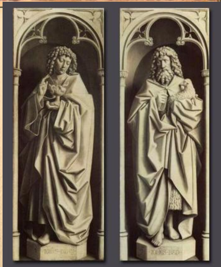
Алтарь Геллера Маттиас Грюневальд

Техника гризайли широко использовалась в станковой живописи в Средние века. Примером может служить Алтарь Геллера, созданный Маттиасом Грюневальдом и Альбрехтом Дюрером. Кисти Грюневальда принадлежат внешние створки, на которых изображения святых имитируют скульптуру.