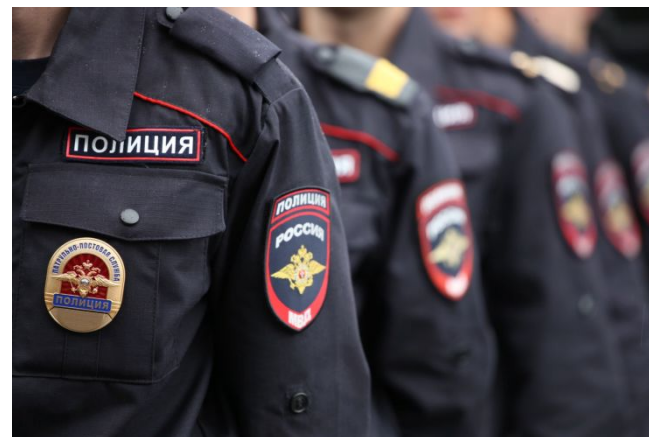
Внутренняя безопасность государства