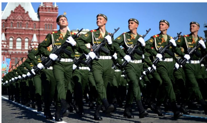
Внешняя безопасность государства