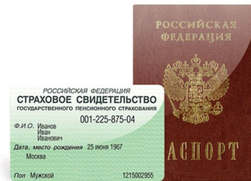
Социальное обеспечение и страхование