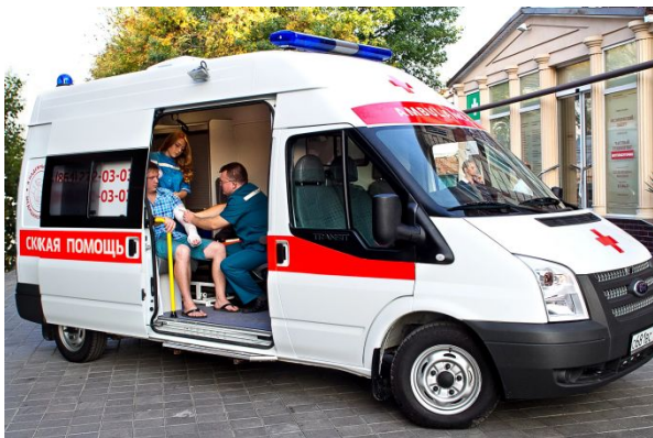
Бесплатная система здравоохранения