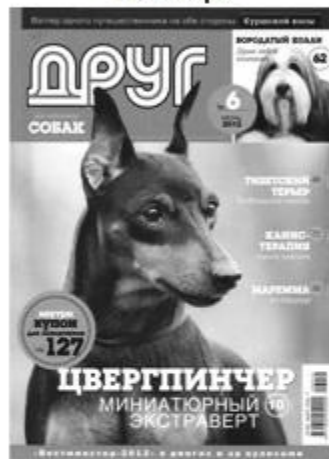
Журнал «Друг собак», 128 стр.