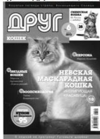
Журнал «Друг кошек», 96 стр.