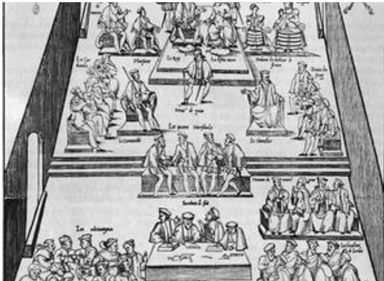
Stany Generalne, zwołane w Orleanie pod przewodnictwem Karola IX i regentki Katarzyny Medycejskiej, rycina z XVI w. — Bibliothèqne nationale, Paryż

Kompetencje Stanów Generalnych nie zostały dokładnie określone, a sprzeczności między przedstawicielami poszczególnych stanów oraz brak inicjatywy ustawodawczej ograniczyły ich znaczenie. Królowie rzadko zwoływali Stany Generalne - w okresie absolutyzmu nie zwoływano ich przez 174 lata, mimo że teoretycznie (według XIII-wiecznego stanowiska) miały one decydować o nowych podatkach.