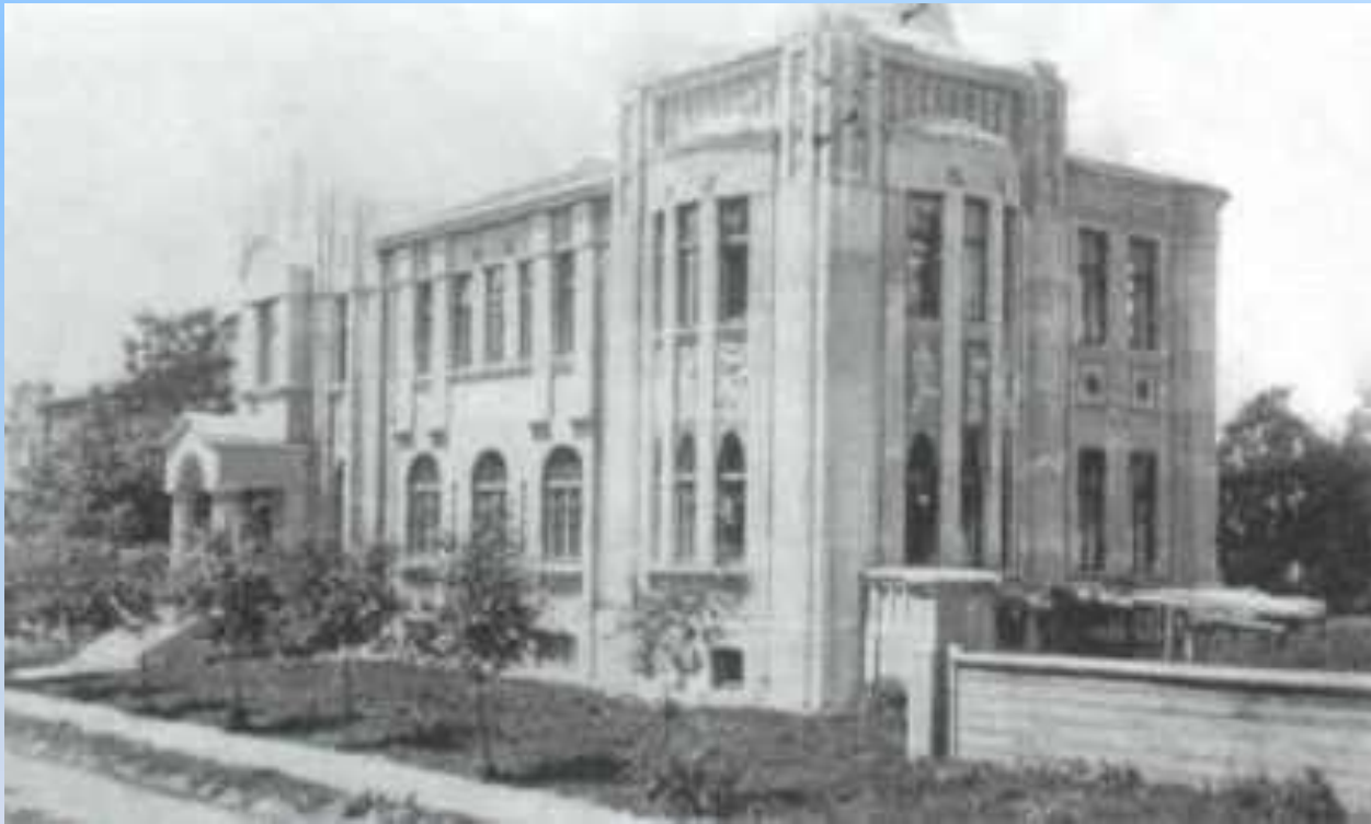
«Водозлектролечебница им. С.И. Бабыч»