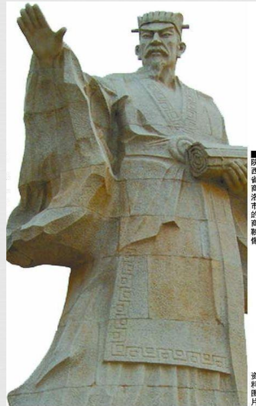
陕西省商洛市的商鞅像