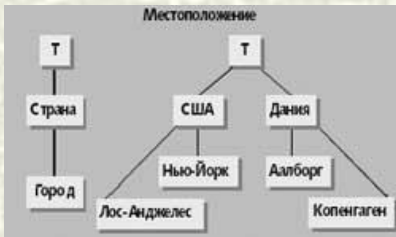
Схема «Местоположение» для данных продаж:

Из трех уровней измерений местоположения самый низкий — «Город». Значения уровня «Город» группируются в значения на уровне «Страна».