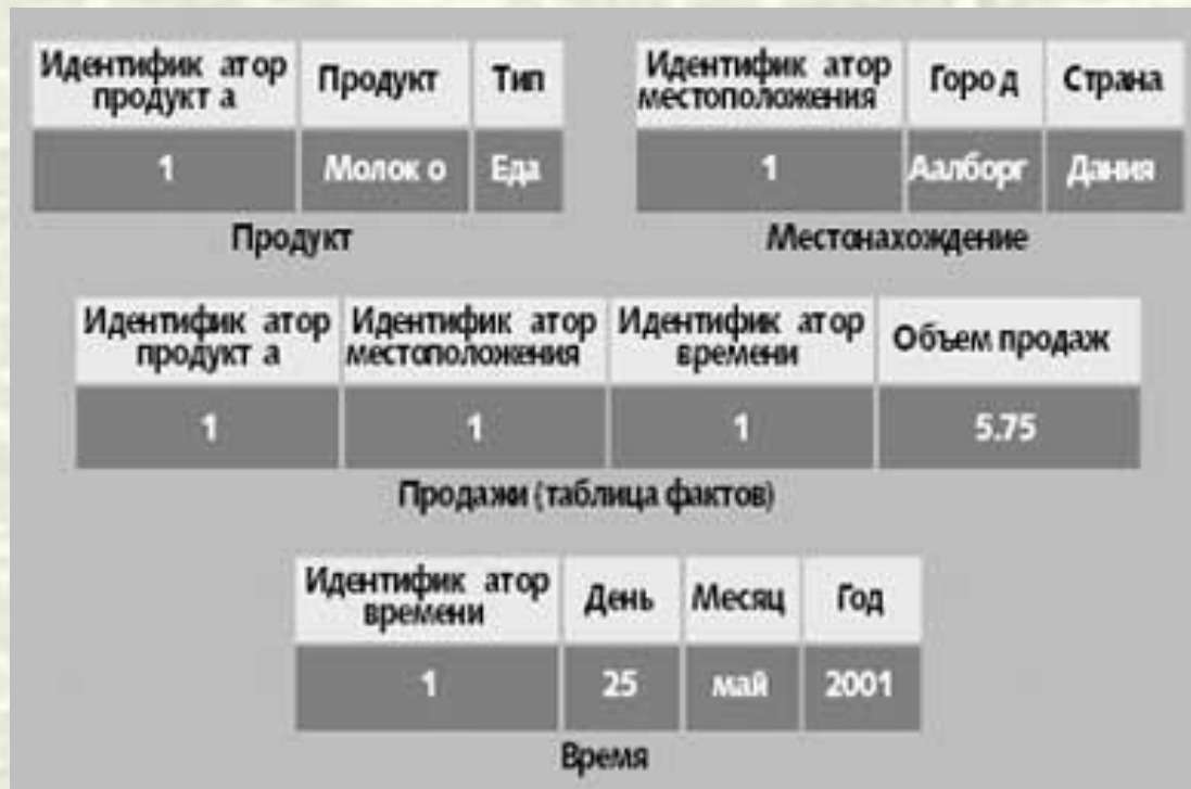
Схема «звезда» для куба продаж:

Информация со всех уровней в измерении хранится в одной таблице измерений, например, названия продуктов и типы продуктов хранятся в таблице «Продукт»