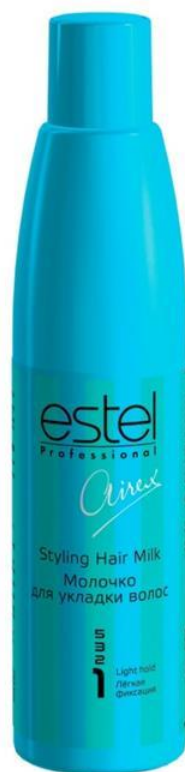
Молочко Для укладки волос Airex