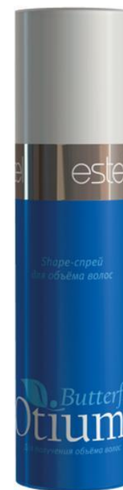
Shape-спрей Otium Butterfly Для объема волос