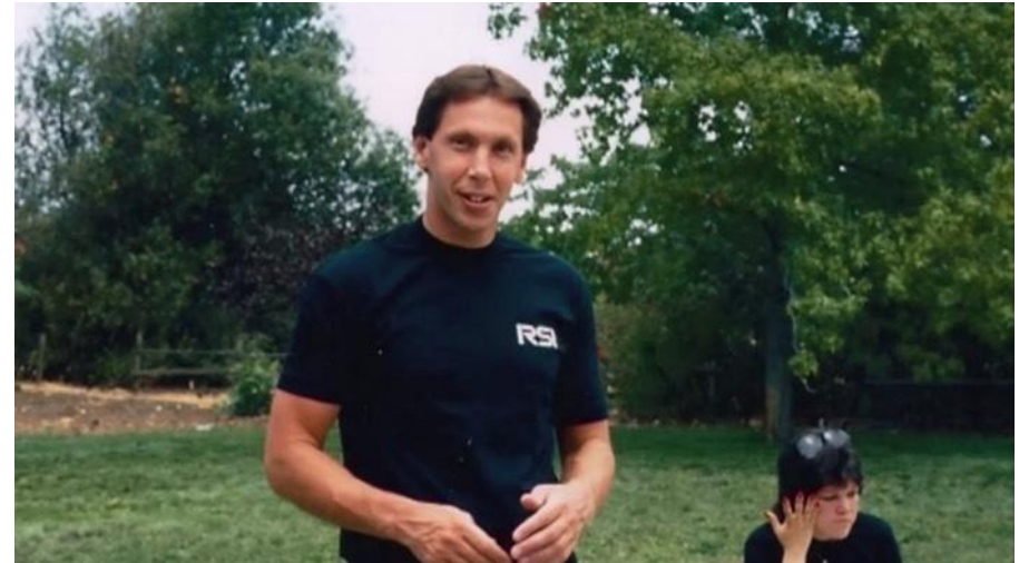
Ларри Эллисон — основатель Oracle