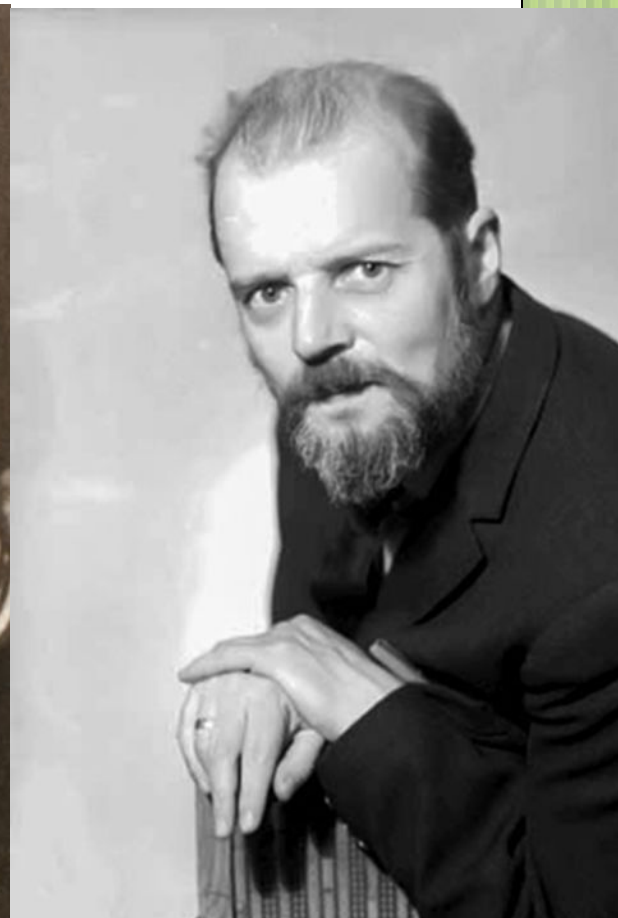
Александр Есенин- Вольпин