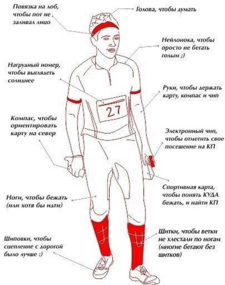
Обычный ориентировщик в полной спортивной амуниции