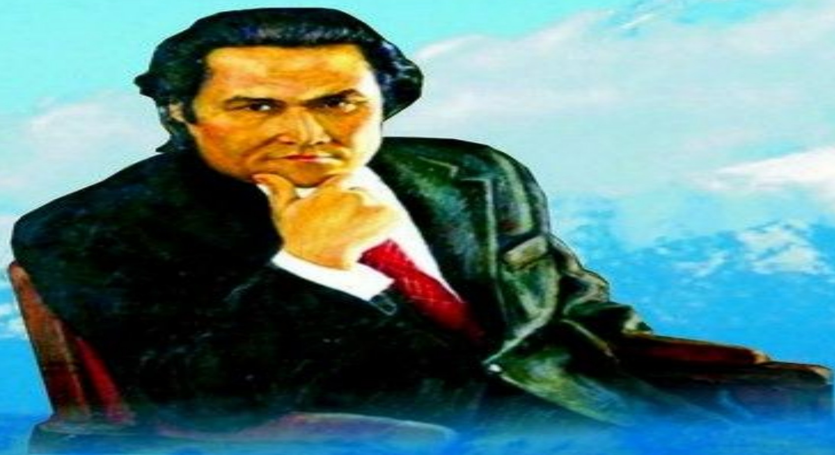
Мұқағали Мақатаев 1931-1976