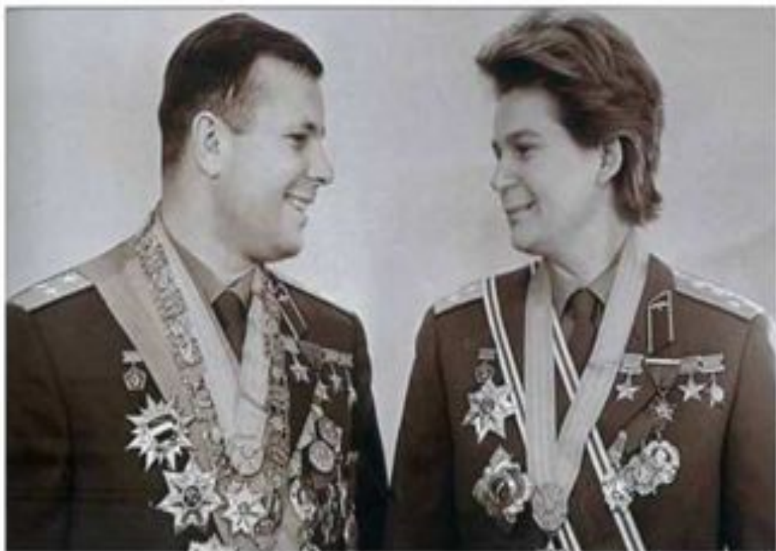
Ю.Гагарин и В. Терешкова.