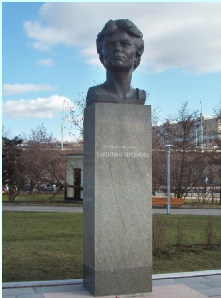
Памятник Валентине Терешковой в Москве