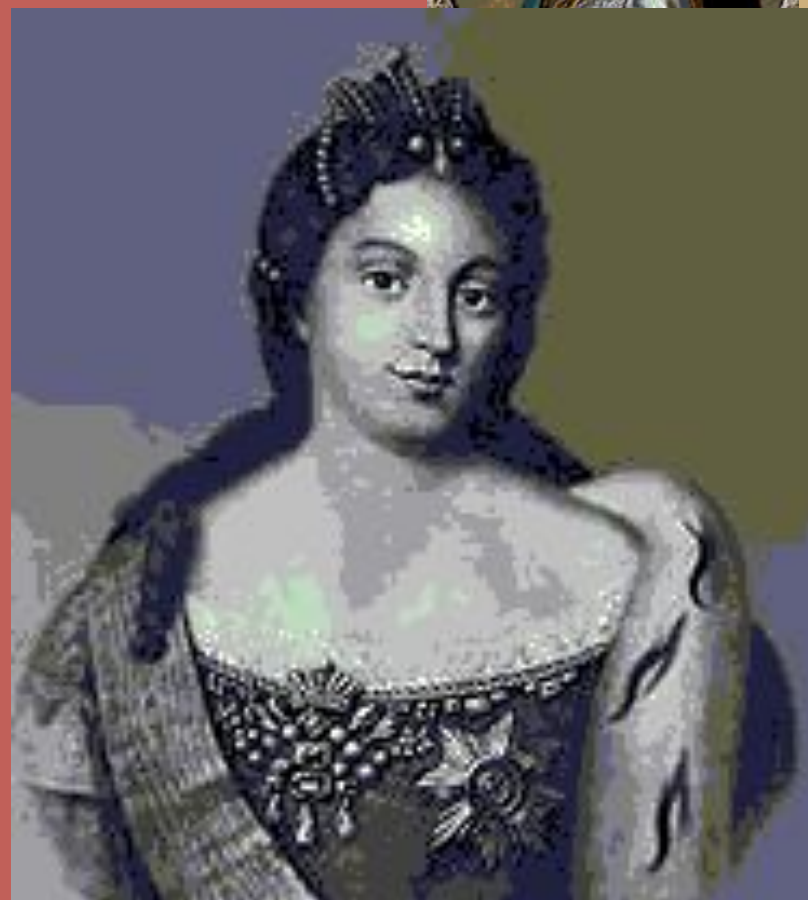
Марта Скавронская (Екатерина I)