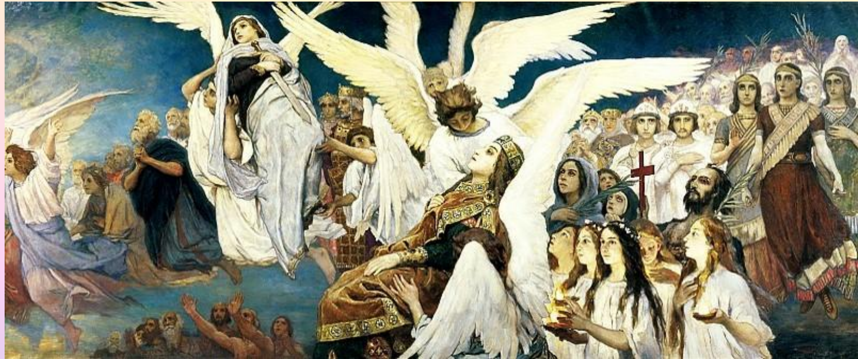
А.К.Толстой «В стране лучей»