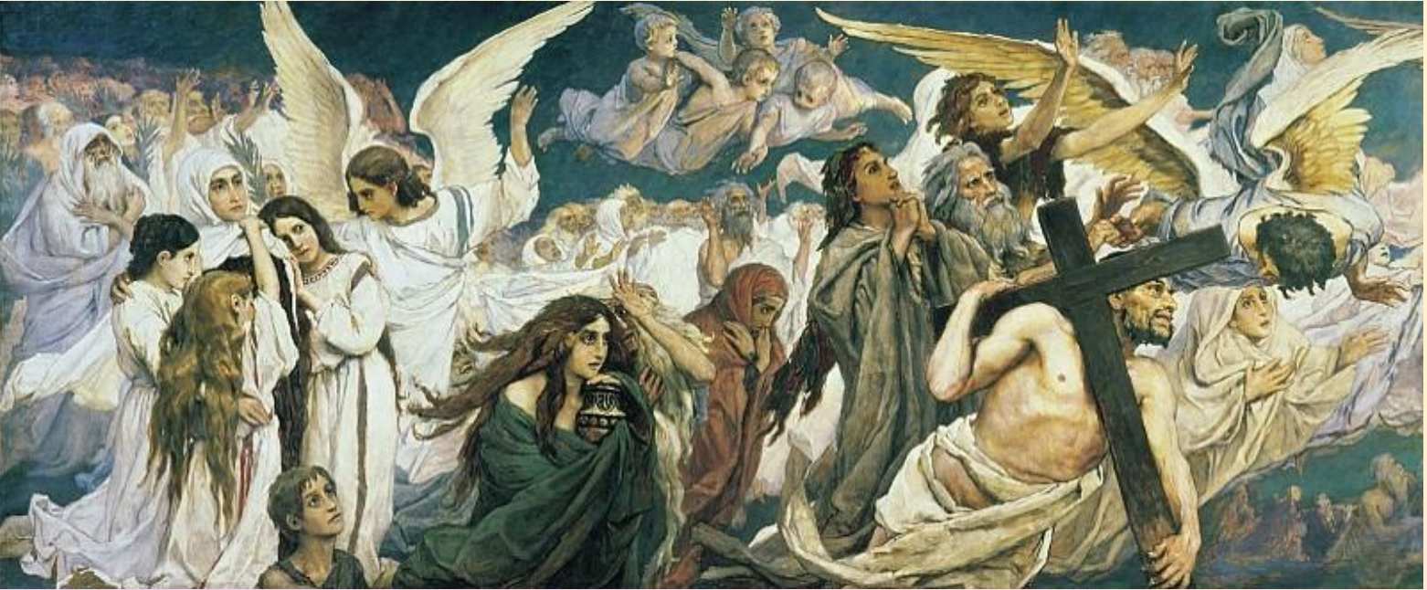
А.К.Толстой «В стране лучей»