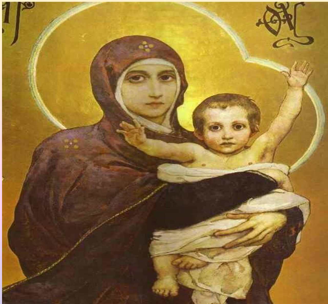
Романов К.К. Владимирской иконе Божией Матери

С какою кротостью Искорбью нежной Пречистая Взирает с полотна! Грядущий час Печали неизбежной Как бы предчувствует она! К груди Она Младенца прижимает И Им любит,ся, О Нем грустя.., Как Бог Он взором Вечность пронизает И беззаботен, как дитя!