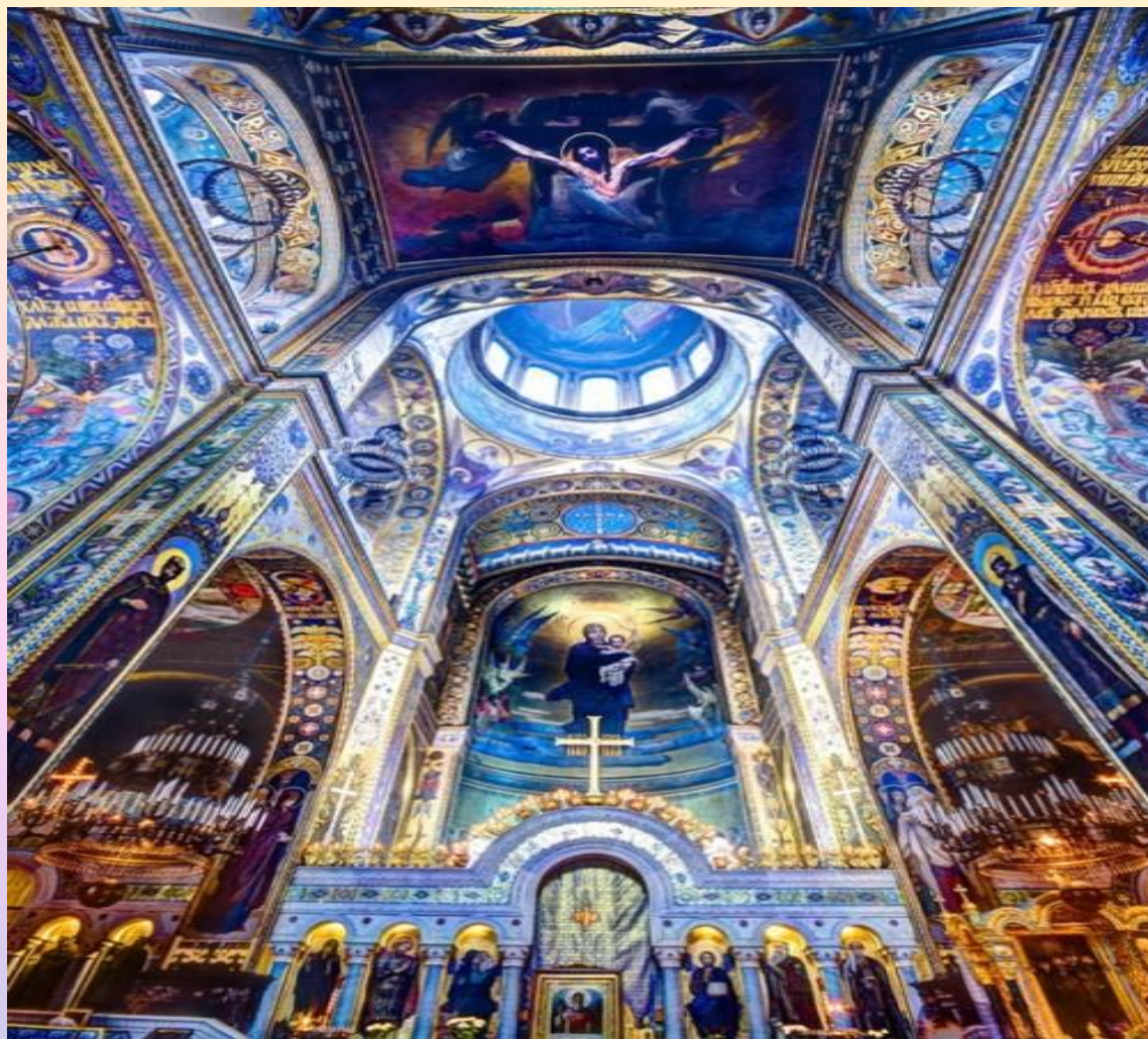
Иеромонах Роман «Благовещение»