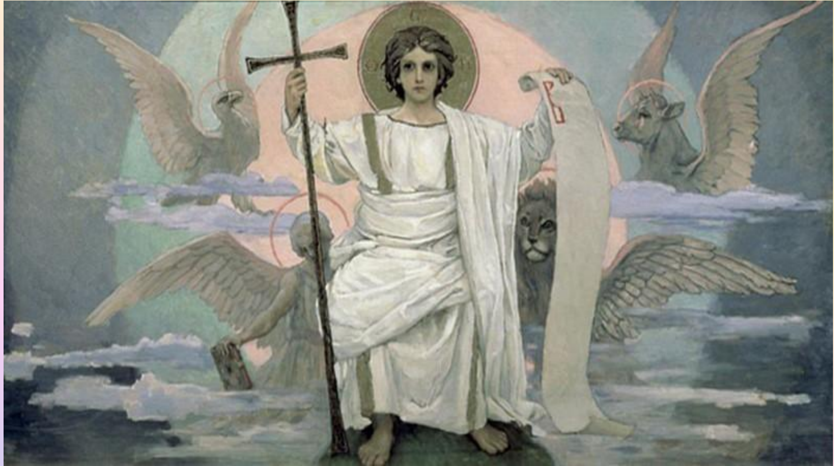
Романов К.К. «Хвалите Господа с Небес»

Хвалите Господа с небес, Холмы, утёсы, горы! Осанна! Смерти страх исчез, Светлеют наши взоры. Хвалите Бога, моря даль И океан безбрежный! Да смолкнут всякая печаль И ропот безнадежный! Хвалите Господа с небес И славьте, человеки! Воскрес Христос! Христос воскрес! И смерть поправ навеки!