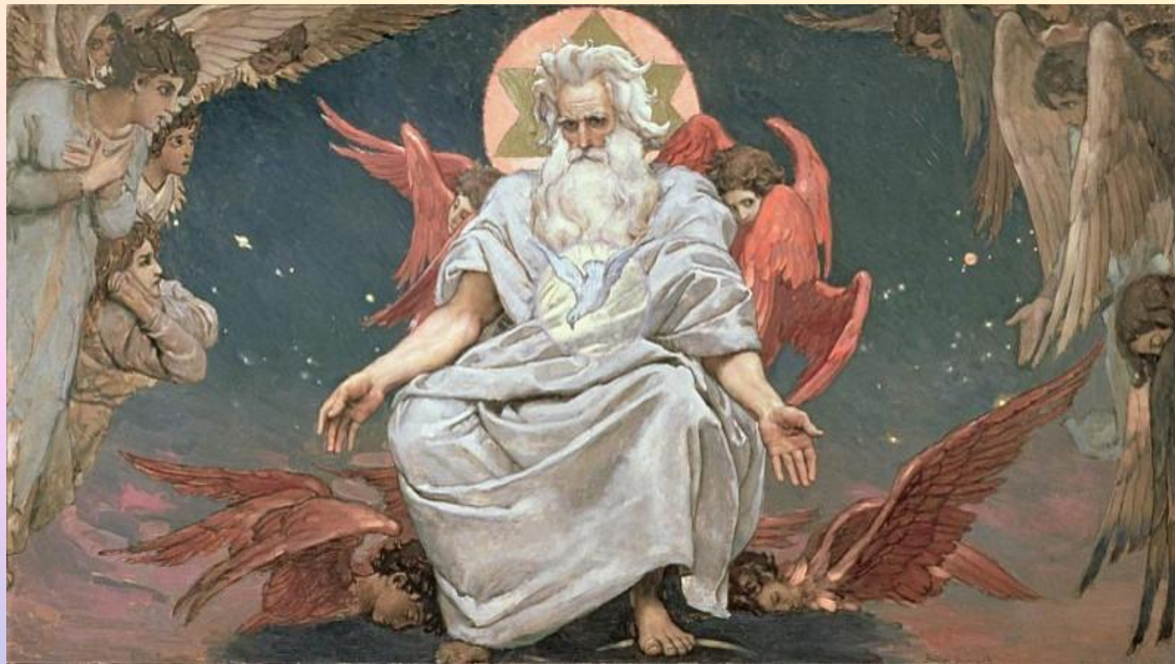
Романов К.К. «Хвалите Господа с Небес»