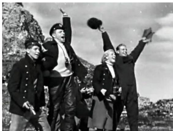
Семеро смелых. 1936