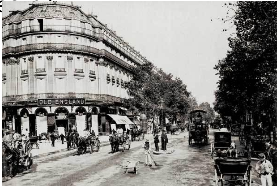
В Париже на бульваре Капуцинов, 1895