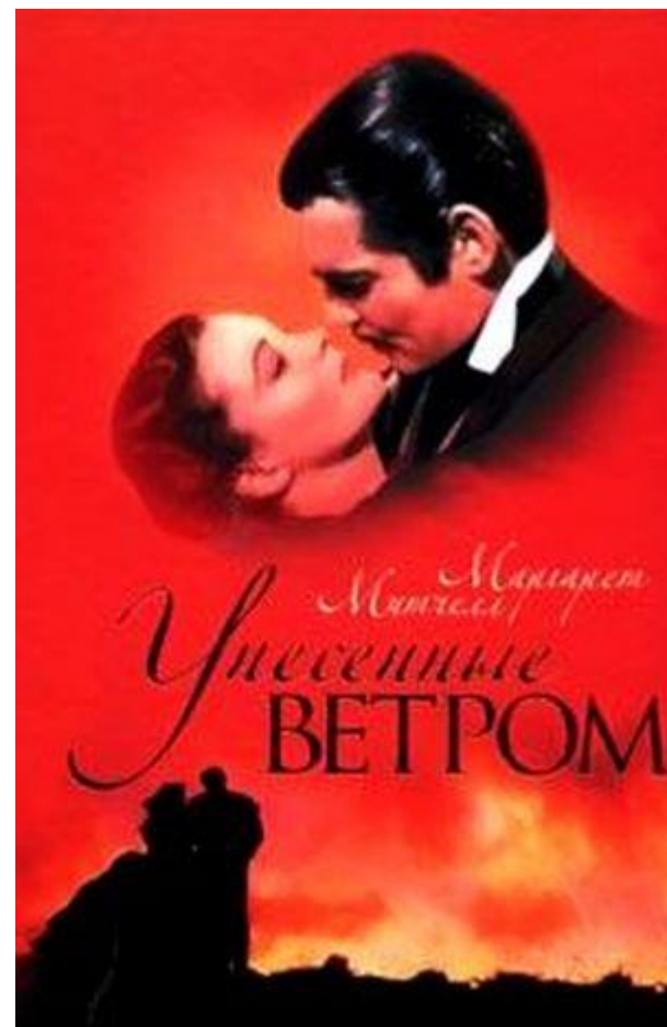
Вивьен Ли, Кларк Гейбл