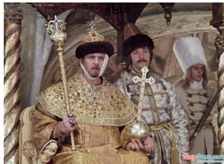
Иван Васильевич меняет профессию»