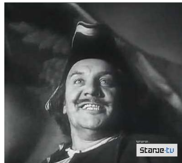
Петр Первый, 1937