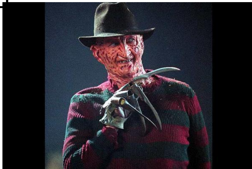
Фредди Крюгер из киносериала «Кошмары на улице Вязов»

10. Этого героя серии фильмов мы не можем представить без свитера в красно-зеленую полоску. А между тем, он первоначально должен был появиться на экране в черном кожаном плаще, но плащ костюмеры потеряли, и пришлось помощнику оператора пожертвовать свой свитер, связанный для него его невестой. Не киногероя?