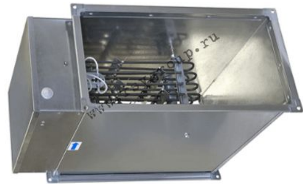
Канальный нагреватель прямоугольный