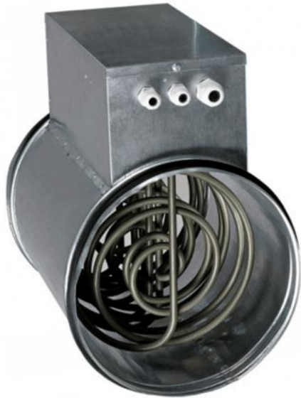
Канальный нагреватель в круглый