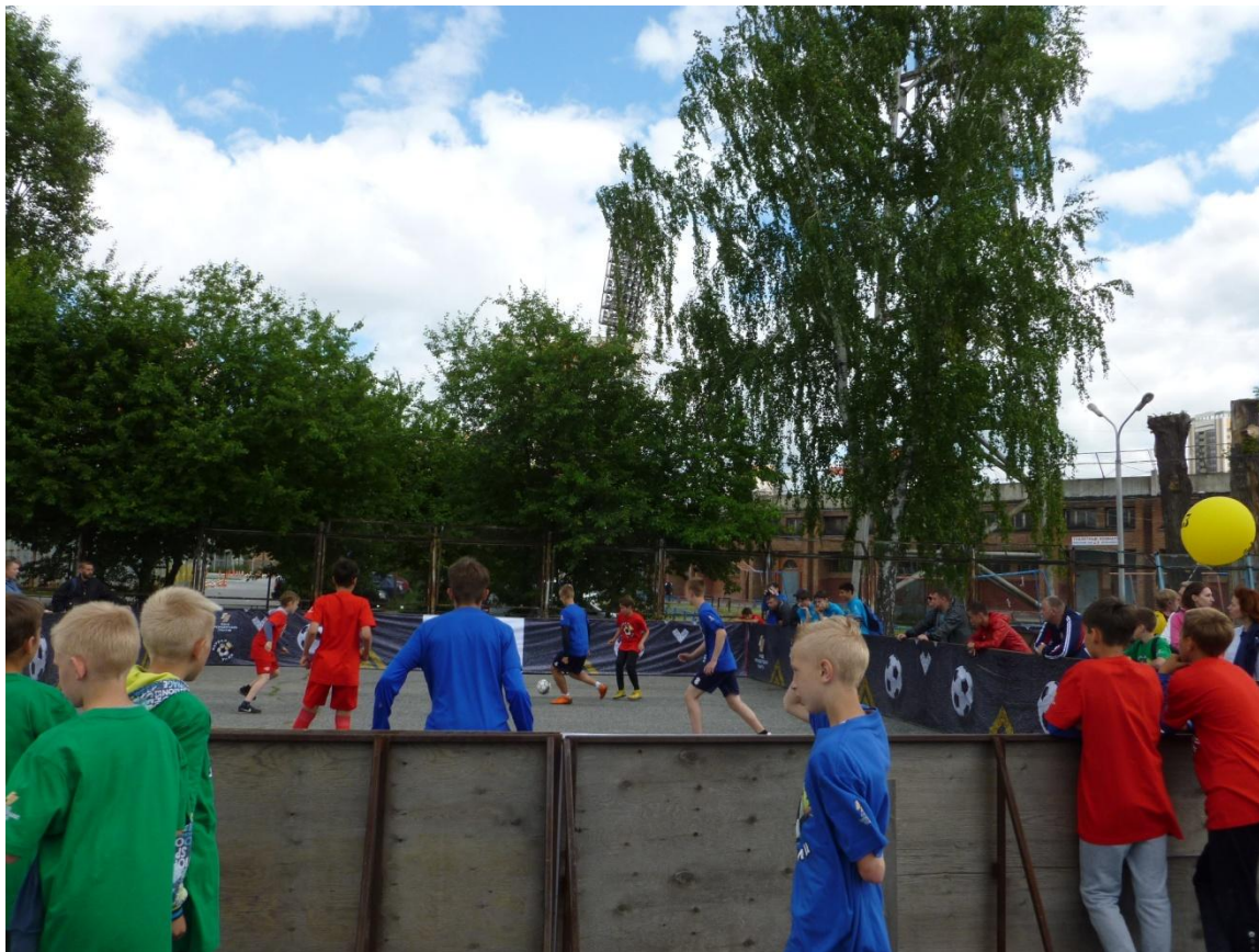
Фестиваль дворового и детского футбола Стадион «Спартак»