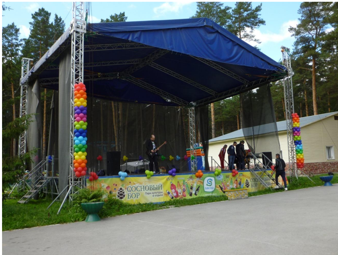
Музыканты проверяли звук